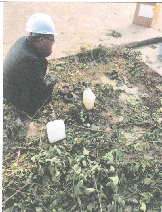
河南利华制药有限公司东厂 地下水监测井检测照片