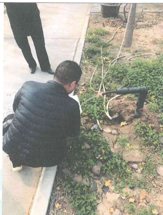
河南利华制药有限公司西厂附近中波站 地下水监测井检测照片